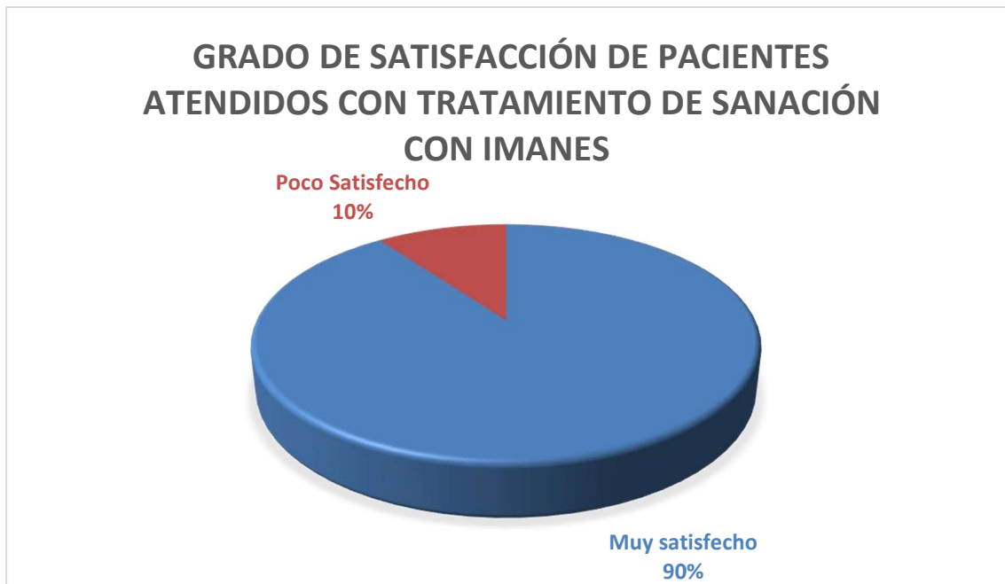
Gráfico #3. Grado de satisfacción de pacientes atendidos con tratamiento de sanación con imanes.

Elaborado por: Virginia Marisol Chico P.